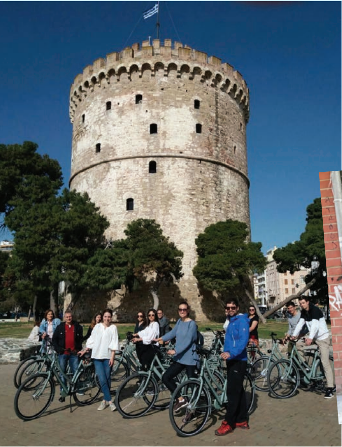
Thessaloniki verrast iedere keer weer