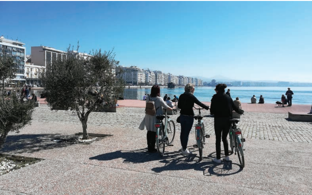
Aan de golf van Thessaloniki

Een kijkje in de keuken van een Grieks huishouden maakt je ontdekkingsstocht helemaal af. Op de oudste en bekendste markten van de stad laat je je onderdom-pelen door ontelbare geuren, kleuren en smaken. We denken allemaal wel te weten wat Grieks eten betekent, maar heb je je tanden weleens in de meest bijzon-dere streekgerechten gezet? Bijvoorbeeld